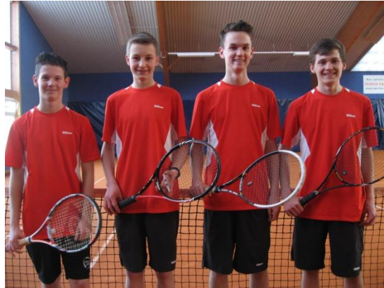
WHR Junioren 2013/14